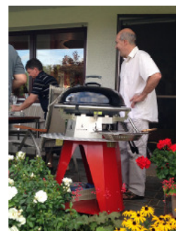
Mit Ablage und Haube Kundenwunsch