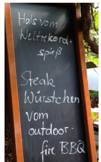
Hoffest Talheimer Hof, Sept. 2014