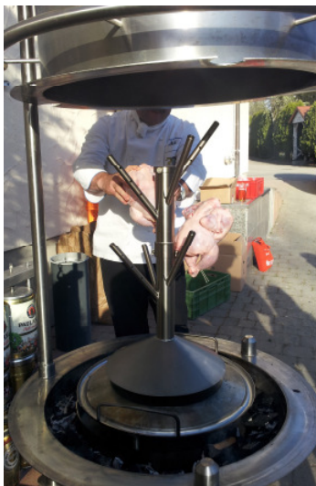
Gockelgrillen, bis zu 40 Gökkel, Betriebsfest April 2014