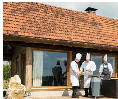
Grillen bei den Lounges, Löwen Zang, Juni 2014