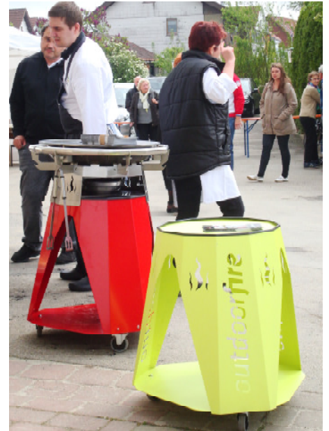
Präsentation outdoor fire BBQ 600 Mai 2014