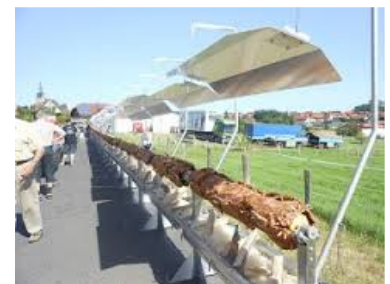
Grillspieß Weltrekord mit 60,55 m

Seit 2008 konstruieren und bauen die Grillpioniere der Ostalb, Friedrich Kral und Günther Schwenk, im Kundenauftrag Holzkohlegrills. Im Jahr 2012 entwickelten und bauten für die Firma Hajatec den längsten Grillspieß der Welt mit 60,55 m.