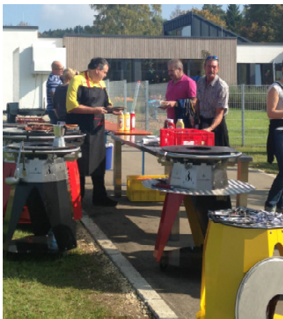
Grillen anlässl. Kindergarteneinweihung Nattheim, Okt. 2014