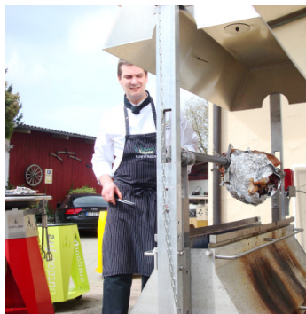
Lamm am Spieß, Löwen Zang, Mai 2014