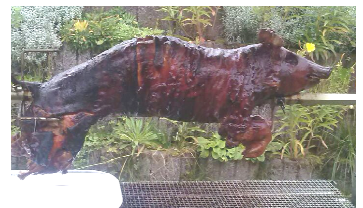
Spanferkel am Spieß, Betriebsfest August 2014