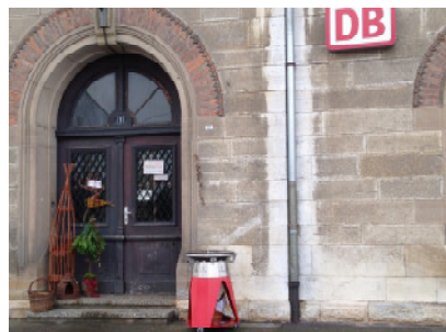
Tag der offenen Tür, Kunst am Bahnhof Hermaringen, Dez. 2014