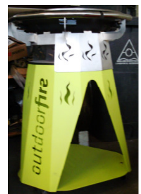
Prototyp outdoor fire BBQ

Es folgten Entwurf und Bau mehrerer Prototypen mit etlichem Probegrillen. Im Herbst 2013 stand das Design und erste Prototypen wurden zur Einholung von Kundenerfahrungen abgegeben. Ein Name musste her. Die Bezeichnung outdoor fire BBQ 600 wurde geboren. 600 steht für den Durchmesser der Grillplatte: 600 mm. Folgen sollte noch ein outdoor fire BBQ 1000.